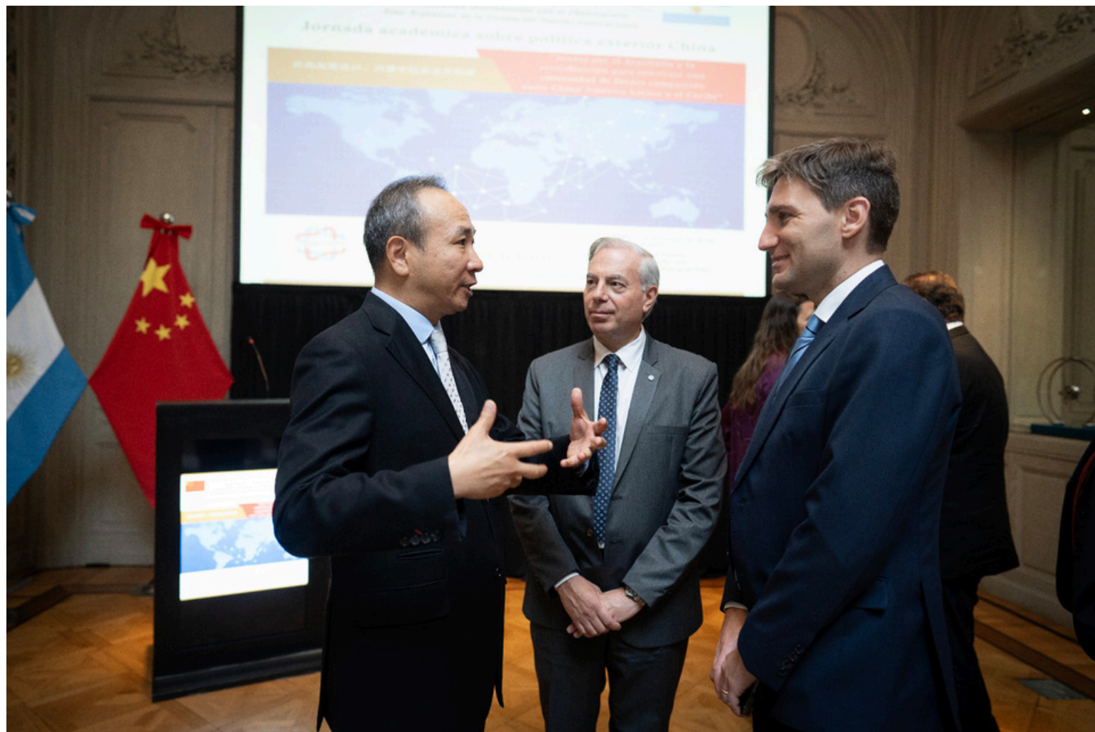
El Embajador chino en Argentina, Wang Wei, dialogando con el Director Ejecutivo del Observatorio Sino-Argentino de la Fundación Nuevas Generaciones, Patricio Giusto.

Esto representa lo que el Embajador denominó como “el futuro compartido entre China y América Latina y la apertura hacia una nueva etapa de esta relación, donde converjan el respeto y la confianza mutua”. De esta manera, Wang Wei hizo referencia a que mientras China apoya la soberanía e independencia de los países latinoamericanos y se posiciona en contra de cualquier tipo de injerencia externa en la región, solicita a los países latinoamericanos que continúen respetando el principio de una sola China. Adicionalmente, destacó a América Latina como una “zona de paz y desnuclearizada” y abogó por una “coexistencia pacífica mundial” en base a un sistema de seguridad común.