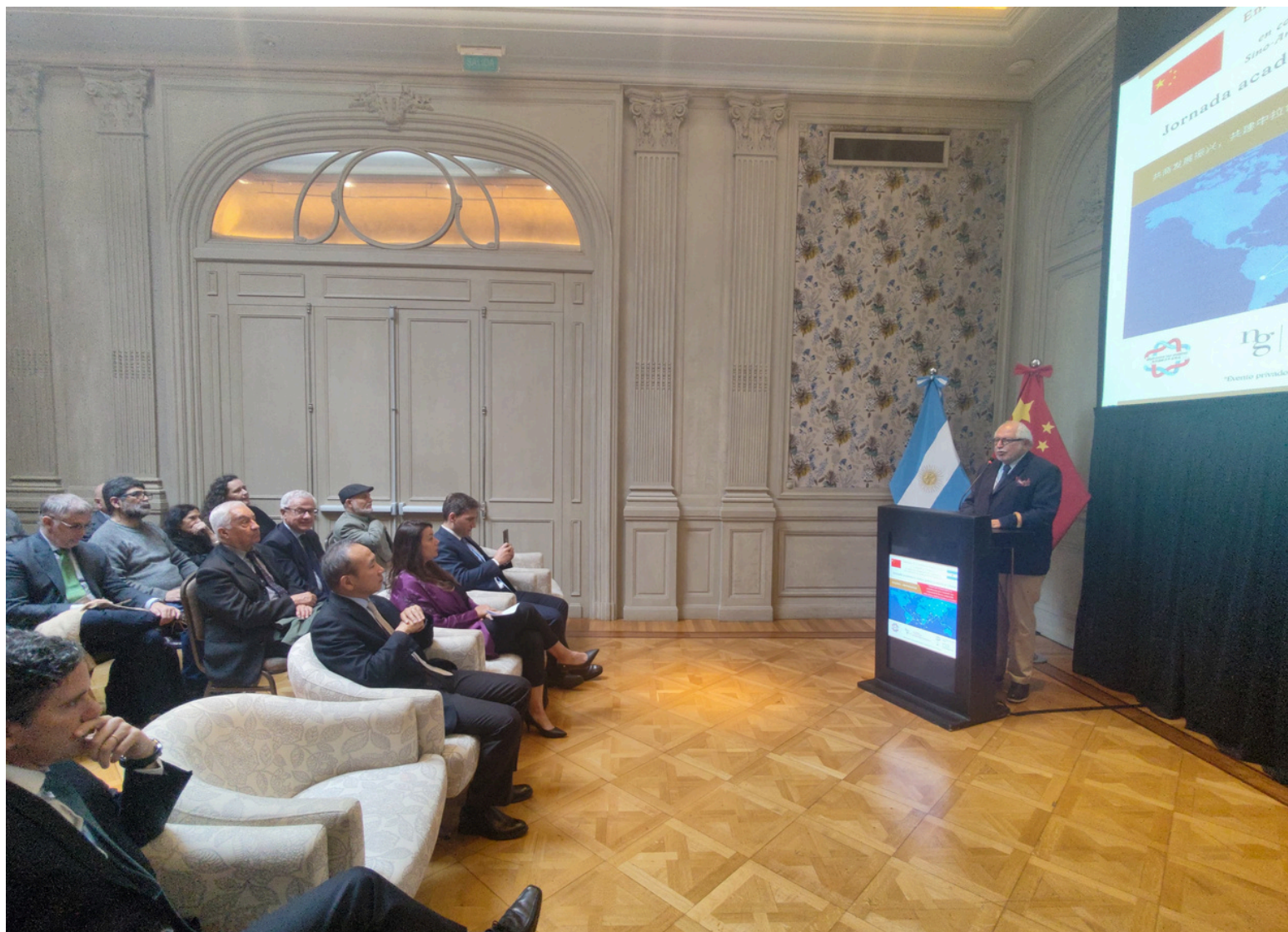
Diego Guelar, exembajador argentino ante China y Presidente del Consejo Consultivo del Observatorio Sino-Argentino, siendo atentamente escuchado por los asistentes.

Por otro lado, Guelar señaló que el sistema internacional se encuentra liderado por un nuevo “triángulo de poder” conformado por el presidente de los Estados Unidos, Donald Trump, su homólogo chino, Xi Jinping, y el Papa León XIV; el cual es “equilibrante y genera optimismo en el mundo” luego de que los aranceles de Trump hayan tenido un impacto negativo en el comercio internacional.