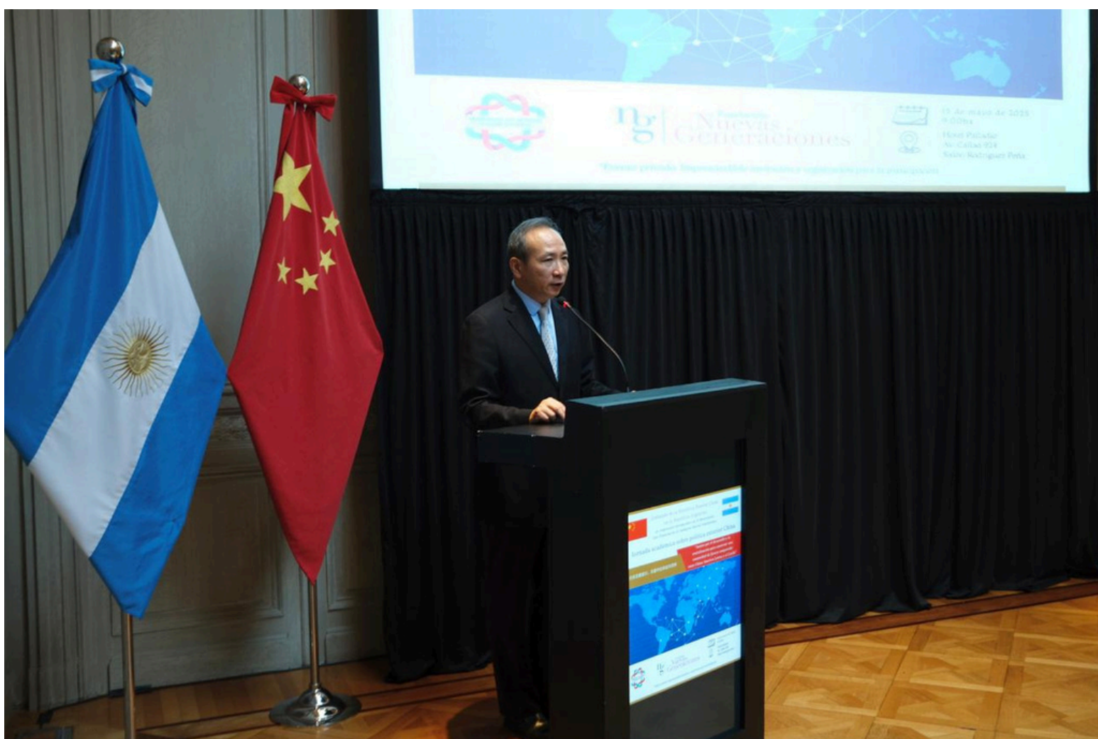
El embajador Wang Wei fue el primer orador de la jornada.

Para finalizar, el Embajador afirmó que a futuro China y América Latina deben comprometerse a ser “socios de respeto, de beneficio y de aprendizaje mutuo”. De respeto, debido a que deben relacionarse para alcanzar los intereses comunes de los países en desarrollo, teniendo presente las bases del derecho internacional y a la ONU en su centro y liderando “la reforma de la gobernanza mundial”. De beneficio mutuo, porque deben acrecentar las oportunidades para la prosperidad global y profundizar la cooperación en diversos campos, como la minería, la infraestructura, la agricultura, entre otros, a través del marco de la Franja y la Ruta. Y de aprendizaje mutuo, puesto que China y América Latina coinciden en una misma apreciación de las civilizaciones y fomentan el diálogo entre sí.