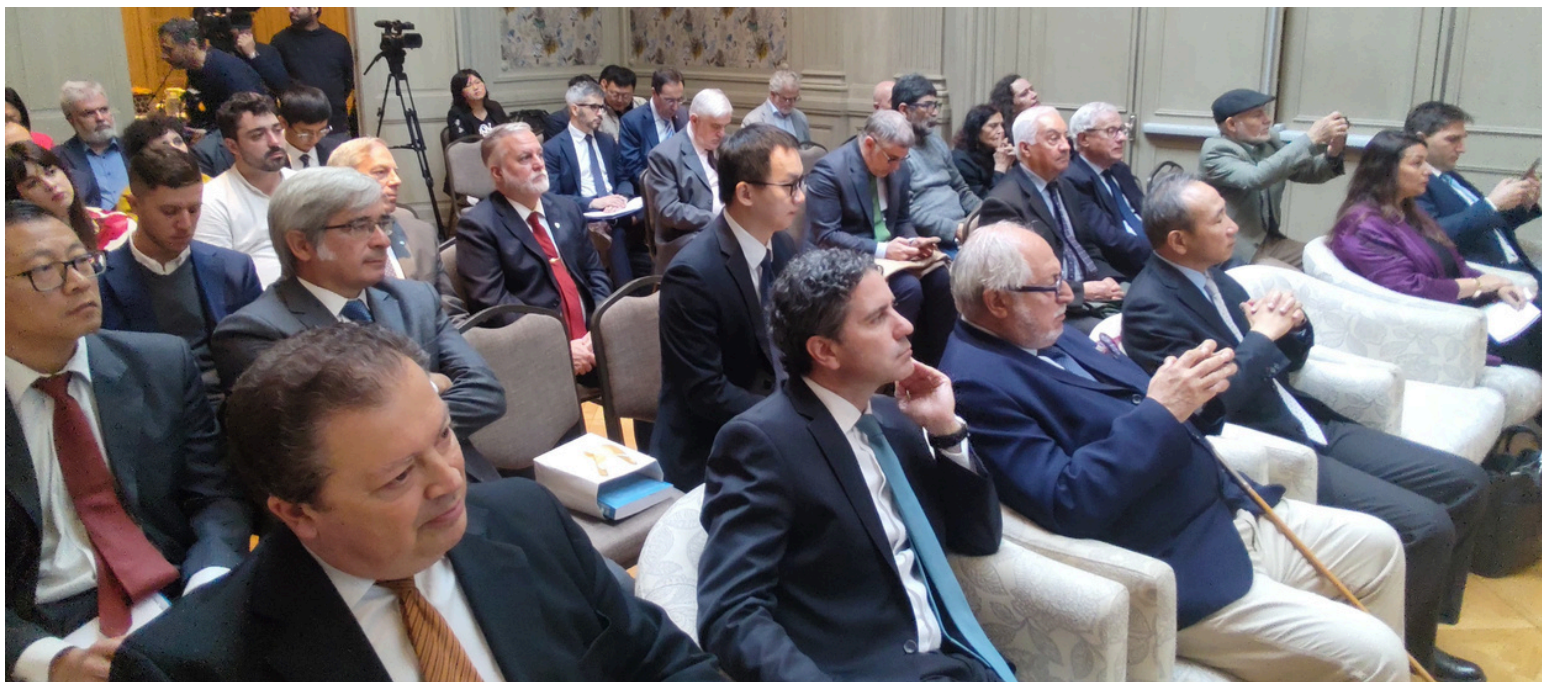
El evento contó con una nutrida participación de referentes diplomáticos, académicos y empresariales.